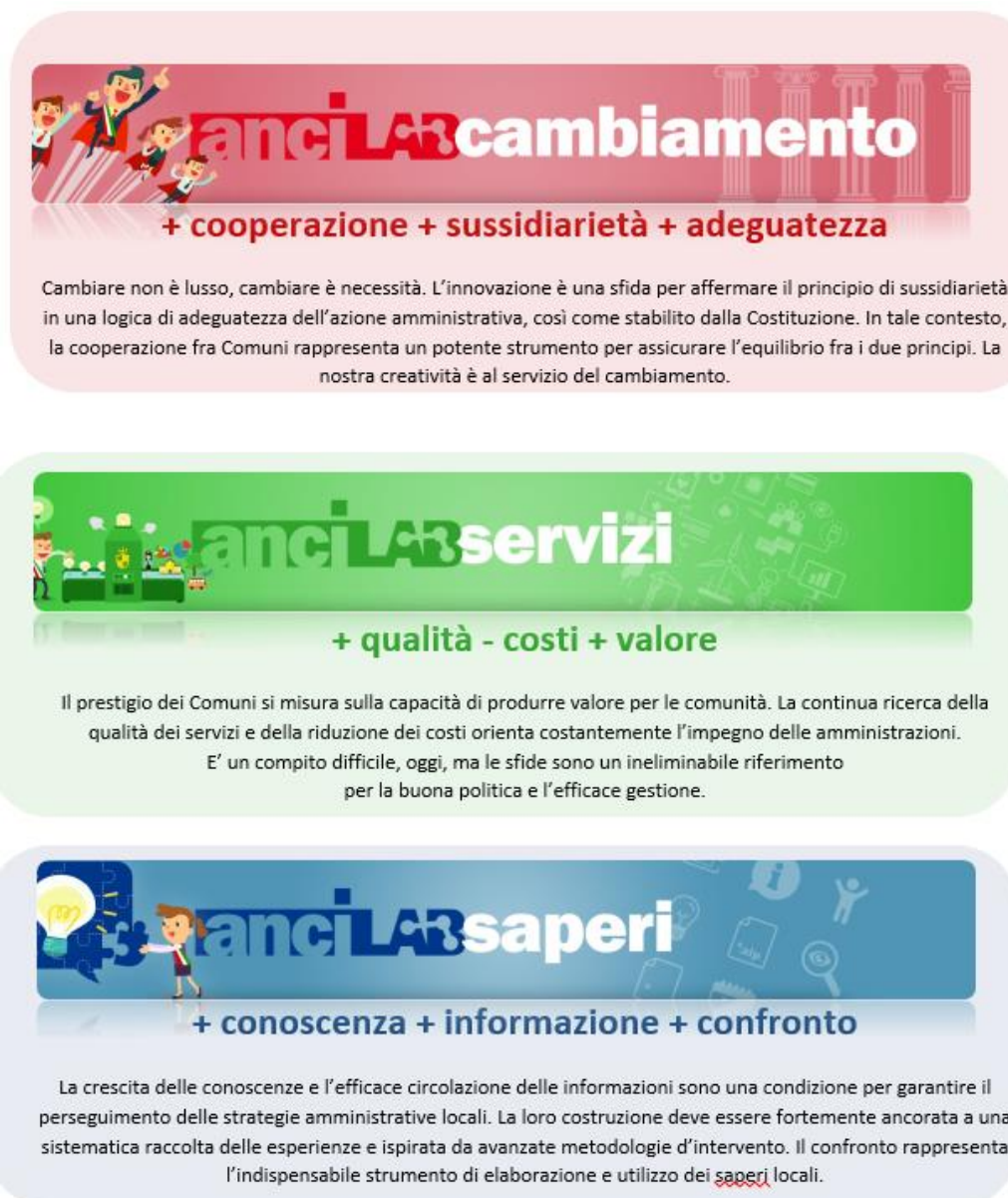
Figura 1 - Aree strategiche